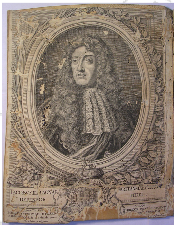
Giacomo II Stuard (in Mus.E.323)

Per maggiore chiarezza le osserviamo separatamente. Iniziamo dalla prima stampa che ritrae Giacomo II Stuart.