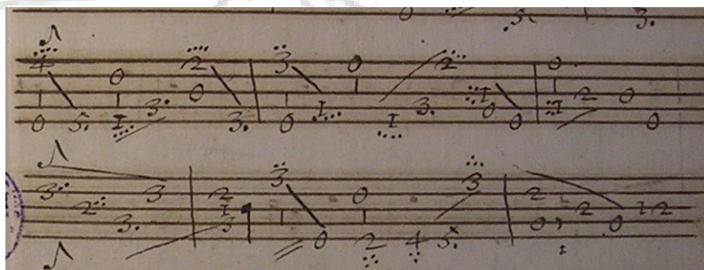
Particolarità dell'intavolatura nel manoscritto Mus.F.1528

1. nell'intavolatura italiana le 'botte' erano segnate mediante un piccolo tratto verticale posto al di sotto o al di sopra della prima linea; la sua posizione indicava se la botta doveva darsi dall'alto verso il basso o viceversa. Nelle due fonti si impiega invece una figura musicale posta all'interno del pentagramma, la quale indica sia la durata delle 'botte' sia la sua direzione, a seconda della disposizione della gamba della figura rispetto alla testa; questo tipo di notazione è impiegato in una delle fonti più tarde del repertorio per chitarra a cinque cori: Resumen de acompañar la parte con la guitarra di Santiago de Murcia (1714).