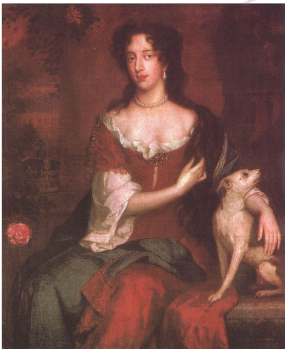
Willem Wissing, Maria Beatrice d'Este , 1685 (Londra, Galleria Nazionale)

Ulteriore conferma ci giunge dalle rilevanti somiglianze delle stampe con i seguenti ritratti di Giacomo II e Maria Beatrice dipinti proprio in quegli anni. Il ritratto di Willem Wissing che ritrae Maria Beatrice è del 1685 ed è tuttora esposto alla Galleria Nazionale di Londra; il ritratto di Giacomo II Stuart di Sir Godfrey Kneller, anch'esso esposto alla Galleria Nazionale, risulta del 1684.