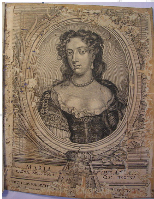
Maria Beatrice d'Este (in Mus.E.323)

Proseguiamo in maniera analoga con la seconda stampa che ritrae Maria Beatrice d'Este.