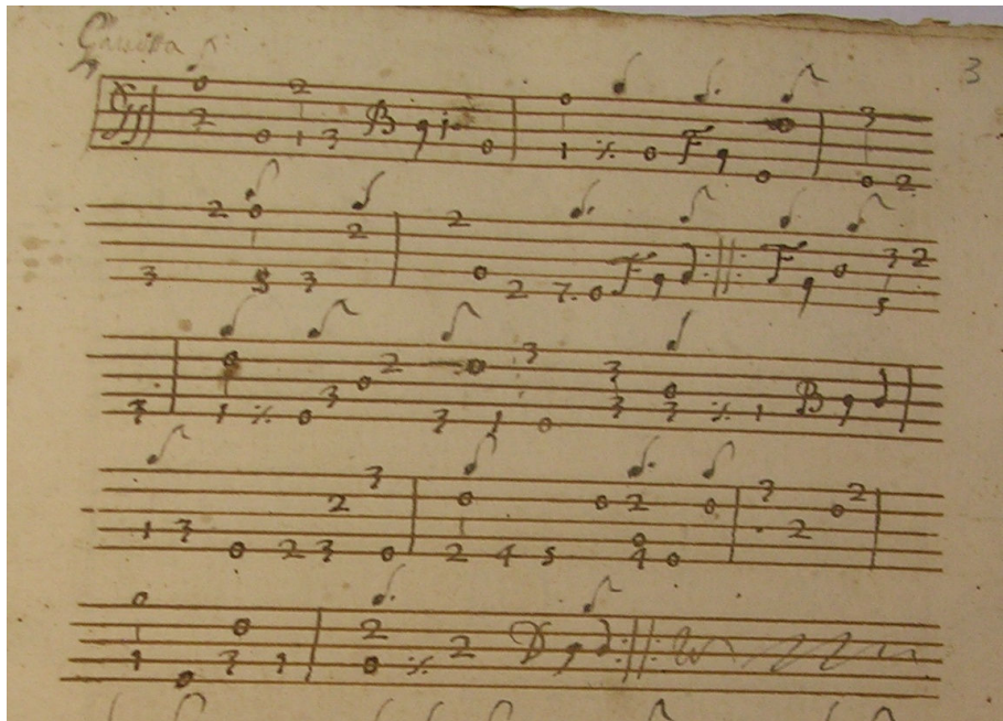
Gavotta n. 9, Mus.E.323 (A)

Procederemo ora al confronto dell'unico brano presente in entrambi i manoscritti, una Gavotta, rimasta purtroppo anonima.