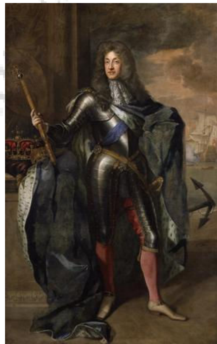
Godfrey Kneller, James II Stuart , 1684 (Londra, Galleria Nazionale)